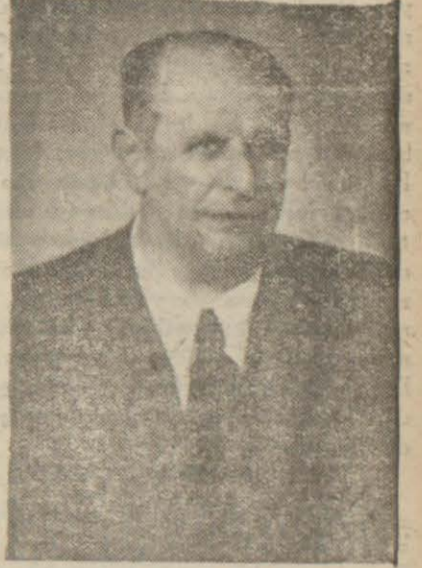
Ticaret Vekili Nazmi Topçuoğlu